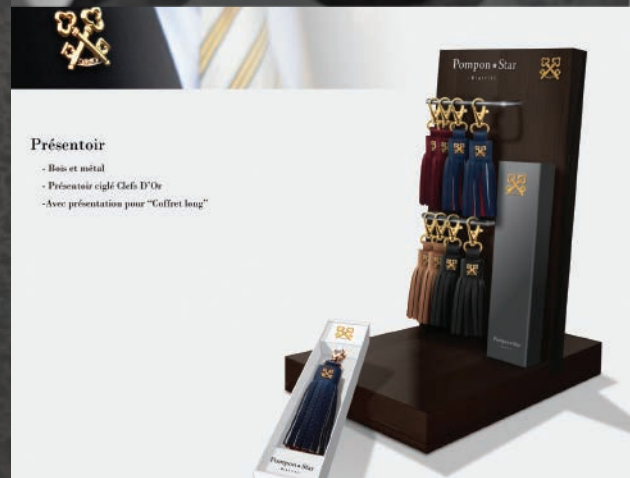
Pompon Star, fin 2017 Intervention en tant d'indépendant

Projet pour un partenariat entre Pompon Star et Les Clefs d'Or : logo, packaging, livret, présentoir etc.